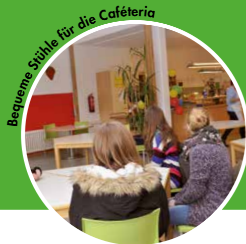
Bequeme Stühle für die Cafeteria