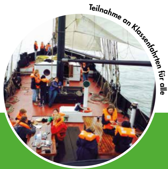
Teilnahme an Klassenfahrten für alle