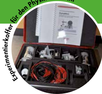
Experimentierkoffer für den Physikunterricht