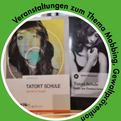
Veranstaltungen zum Thema Mobbing, Gewaltprävention

Auch Ihr Beitrag hilft, diese wertvolle Arbeit fortzusetzen. Schon ab 20 Euro im Jahr!