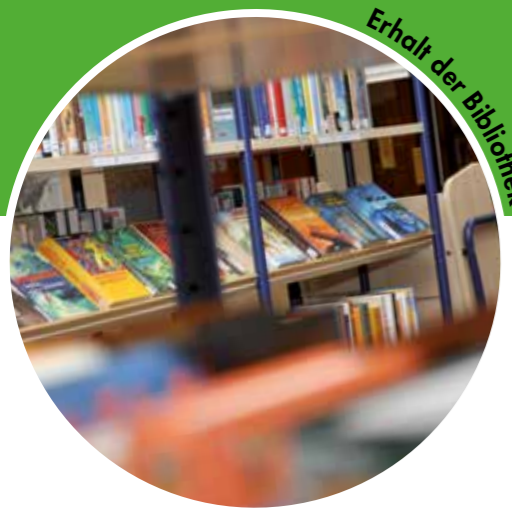
Erhalt der Bibliothek