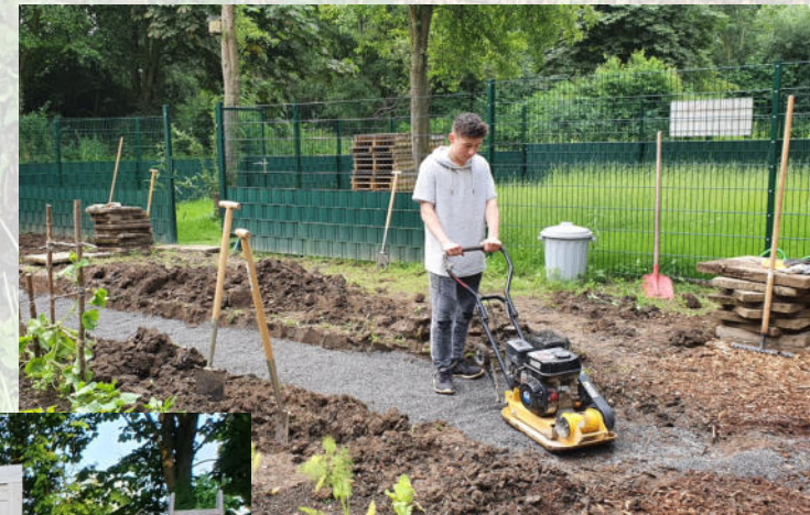
Im Garten haben wir einen großen Geräteschuppen gebaut. Den Weg dorthin haben wir selbst gepflastert.